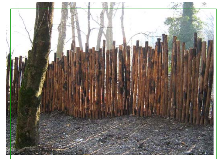
PROTEZIONE VISIVA CON TONDELLI