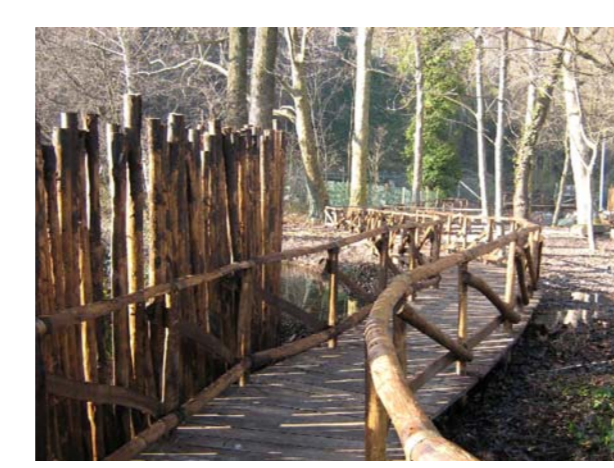
PASSERELLA PEDONALE IN LEGNO